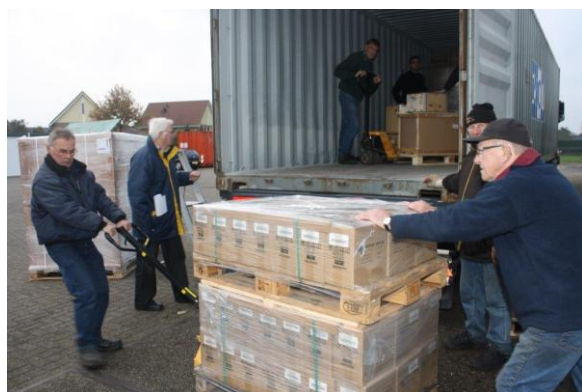
HHCP cargando los equipos de Victron en contenedores

Victron, el especialista en energía eléctrica, desarrolla continuamente nuevas soluciones para el uso de energía en múltiples situaciones. Victron Energy es un respetado proveedor de instalaciones eléctricas independientes (off-grid) en los siguientes sectores: Naval, Industrial, Automovilístico, "Off-grid" y Movilidad. Su gama de productos incluye inversores sinusoidales, inversores/cargadores sinusoidales, cargadores de baterías, inversores CC/CC, paneles de control, el sistema inteligente BatteryMonitor y más. Victron Energy tiene una envidiable reputación en lo que se refiere a innovación técnica, fiabilidad y sostenibilidad. Los productos son reconocidos mundialmente como los preferidos por los profesionales de la generación de electricidad independiente. Para más información sobre Victron Energy visite www.victronenergy.com .